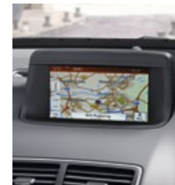
IntelliLink met navi met 7-duims kleurenscherm met hoge resolutie.